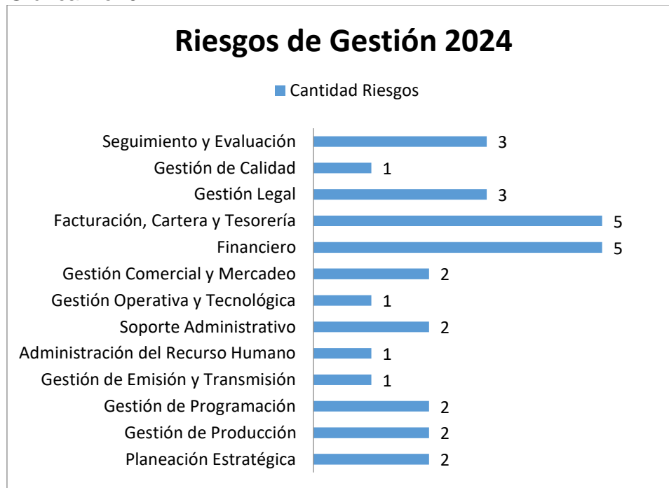
Gráfica No. 02