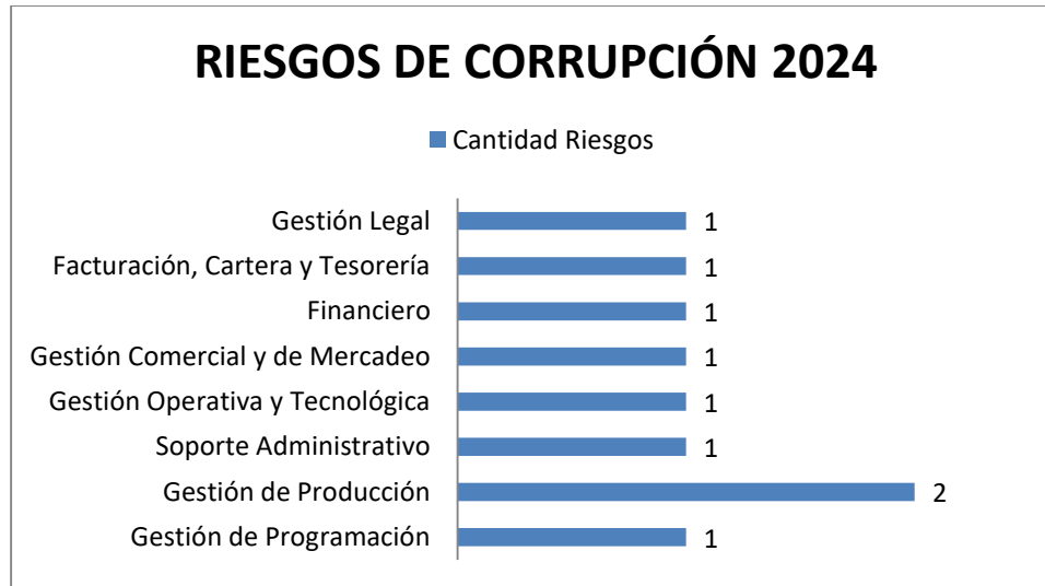
Gráfica No. 01